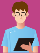
在宅クリニック ドクター