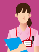
医療連携先 担当者

フットワークが軽く、迅速で正確な対応です。麻薬や輸液などの薬の種類が豊富で無菌調剤までお任せできるのも助かっています。また、患者さまを紹介していただくこともあり、今後も期待しています。